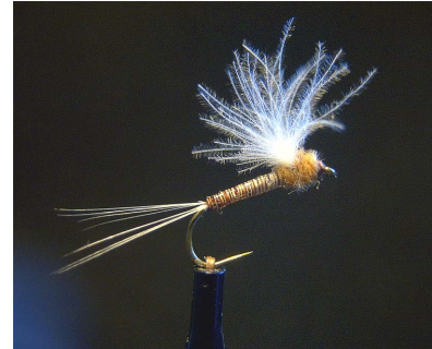
Ansicht von vorne