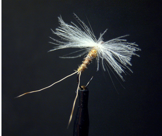
Ansicht von schräg oben